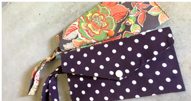
Antara kraftangan yang diajar kepada para peserta.