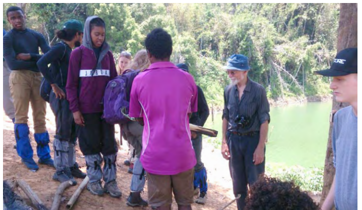
Demonstration of food cooked in bamboo.