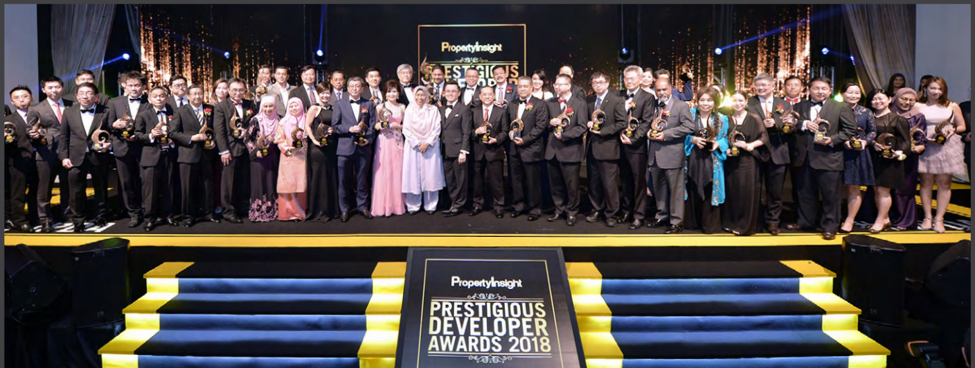
PIPDA - Group Photo.