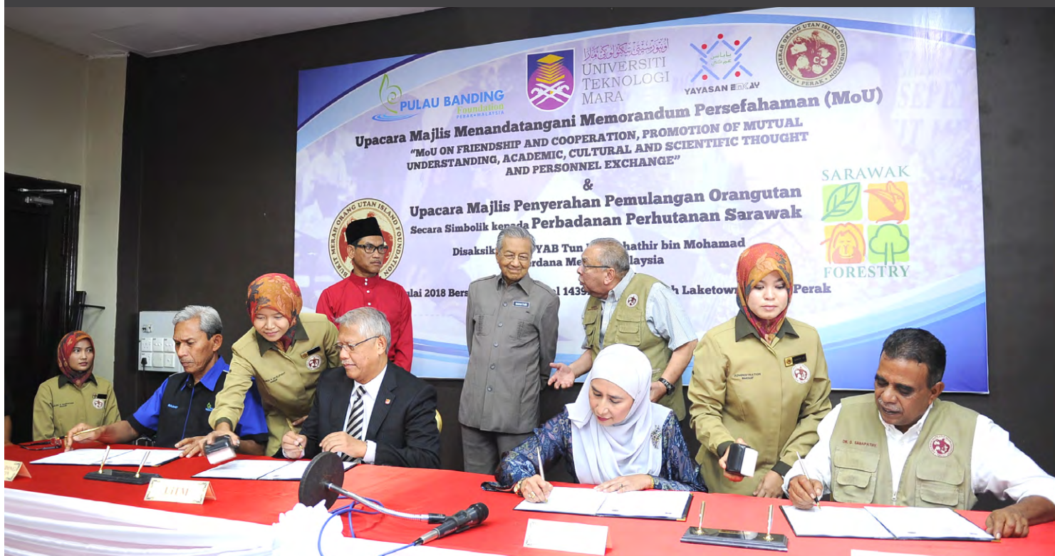
Majlis menandatangani MoU yang disaksikan oleh YAB Perdana Menteri Malaysia, Tun Dr Mahathir bin Mohamad.

Yayasan EMKAY (YE), Pulau Banding Foundation (PBF) dan Yayasan Pulau Orang Utan Bukit Merah (YPOUBM) mencatatkan satu lagi sejarah apabila menandatangani perjanjian persefahaman (MoU) dengan Universiti Teknologi MARA (UiTM) sebagai tanda termenterainya persetujuan untuk mempromosikan kerjasama akademik bertaraf antarabangsa di dalam beberapa bidang tertentu.