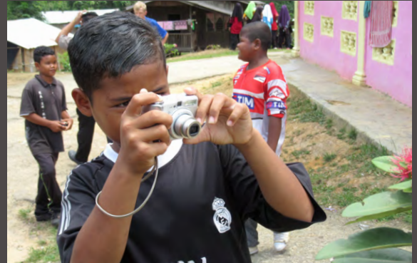
A Banun National Primary School student using a YMP digital camera to explore and photograph his world outside of the classroom at the Banun School.