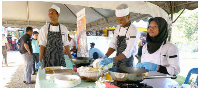
Pameran kerjaya oleh Belum Rainforest Resort.