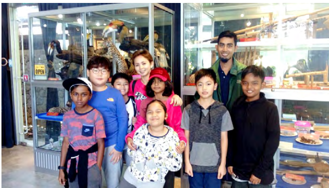
Mutiara International Grammar School, Putrajaya (18 Jan 2018).