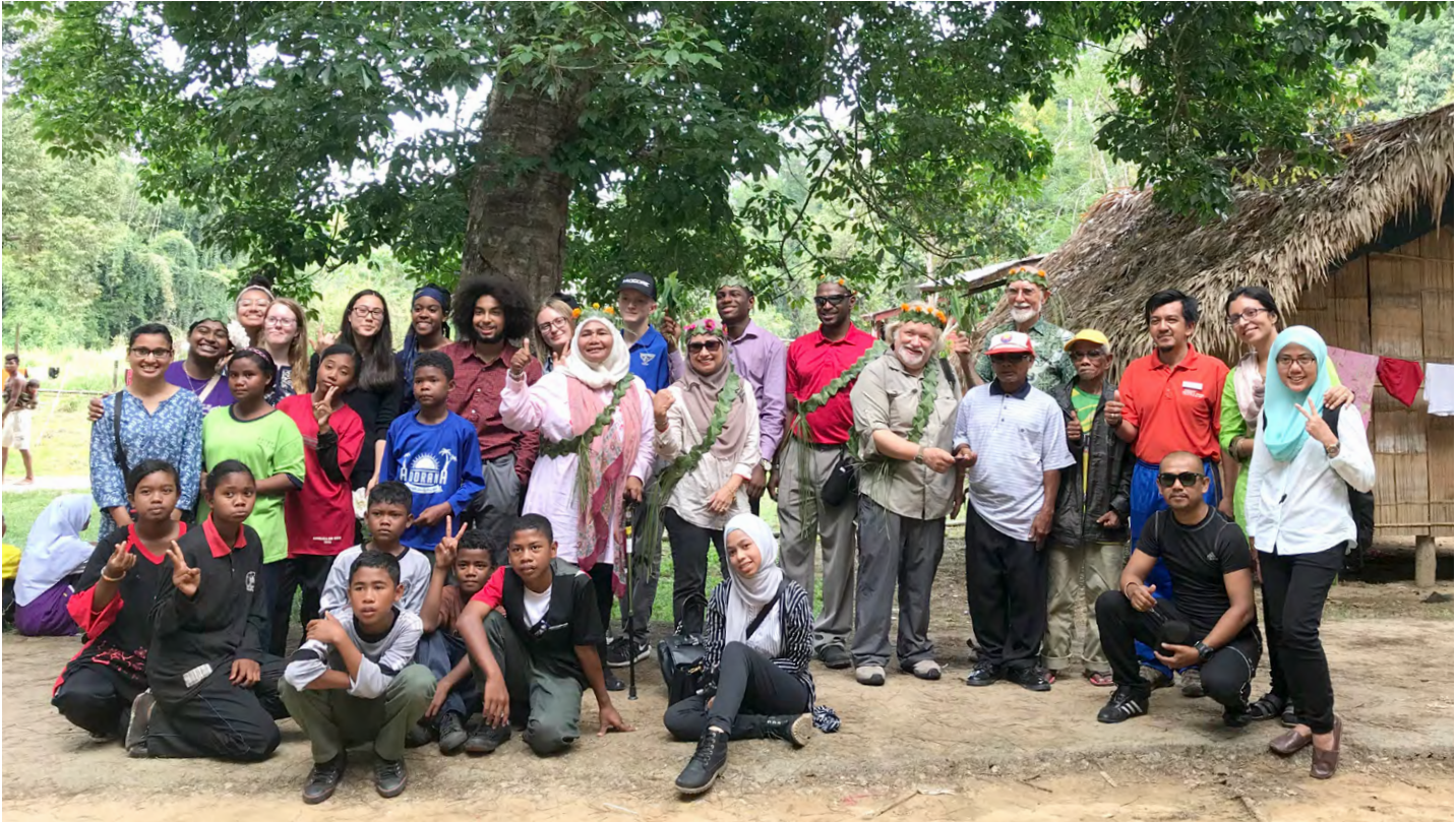
The ICE team with the Orang Asli Students and Yayasan EMKAY staff.