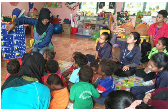
Aktiviti pembelajaran di Perpustakaan Permainan.