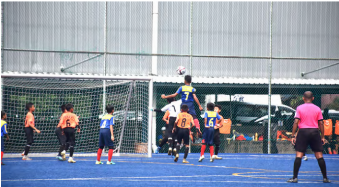
Perlawanan akhir : SK Sg Binjai melawan SK Bukit Naga.