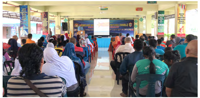
Sesi Taklimat dan Penerangan Imbuan Johan Liga Bolasepak Piala Yayasan EMKAY di SK Kampung Jawa 2.

Kempen ini akan diteruskan sebagai persediaan untuk tahun persekolahan 2019. Sumbangan kepada Kempen "RM50, 1 Pelajar, 1 set pakaian seragam" ini bolehlah disalurkan ke akaun YE, (MBS5642 7610 3608).