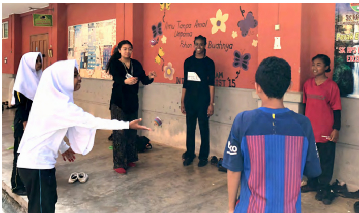
Playing hacky sack.