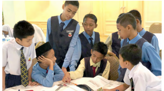
Para peserta sedang berbincang dalam kumpulan masing-masing.