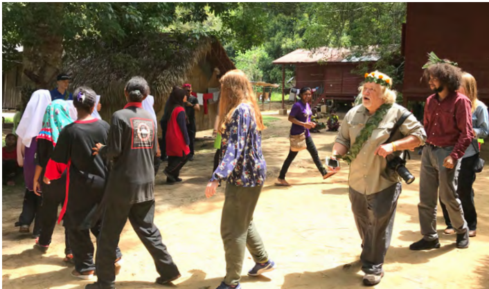
Joining in the fun during the 'Sewang'.