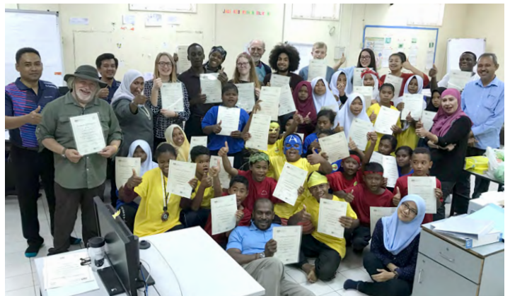
The team with their certificates.