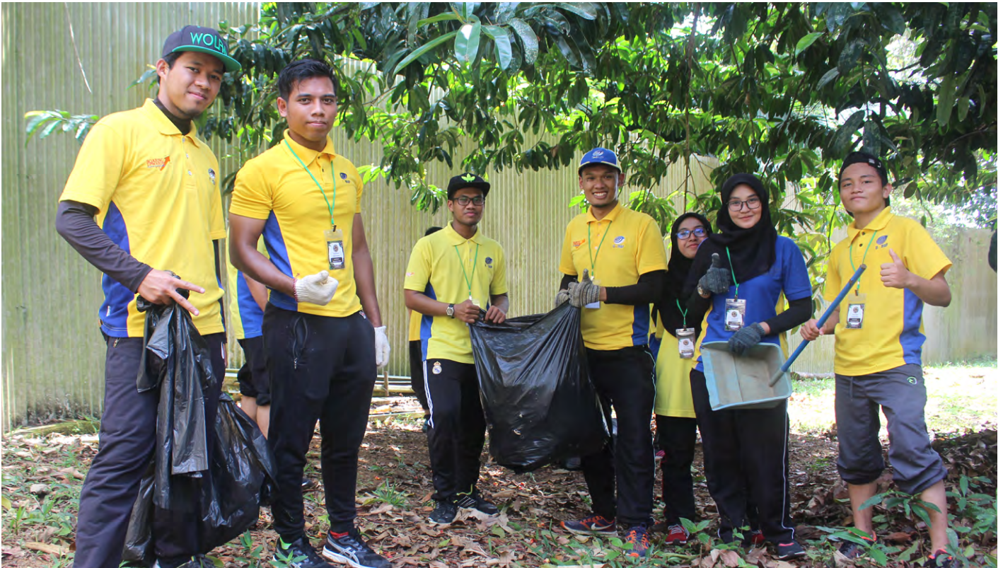
Meluangkan masa untuk aktiviti kesukarelawanan: Peserta UniMAP mejalankan pelbagai aktiviti pembersihan dan gotong-royong di sekitar kawasan YPOUBM.