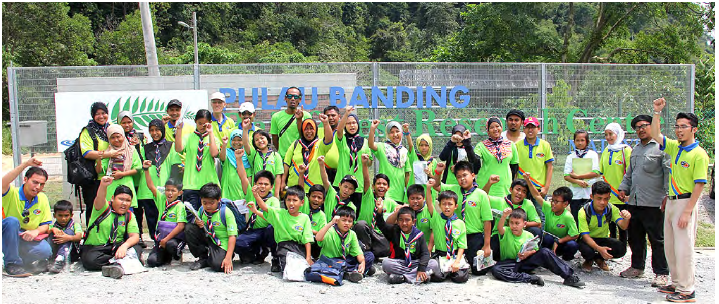
Green Ranger Malaysia (1 April 2018)