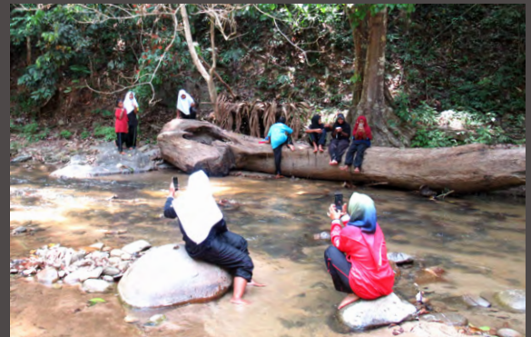
Banun National Primary School students hike to a local waterfall in search of a photo story to tell. One student, after an excursion, wrote, "I'm so happy because I get to walk with my friends, teachers, and villagers."