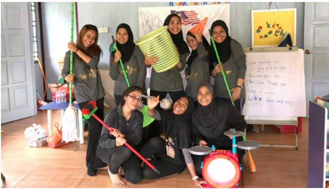
Para sukarelawan dari KVERT turut membantu membersihkan TL Kg Semelor.