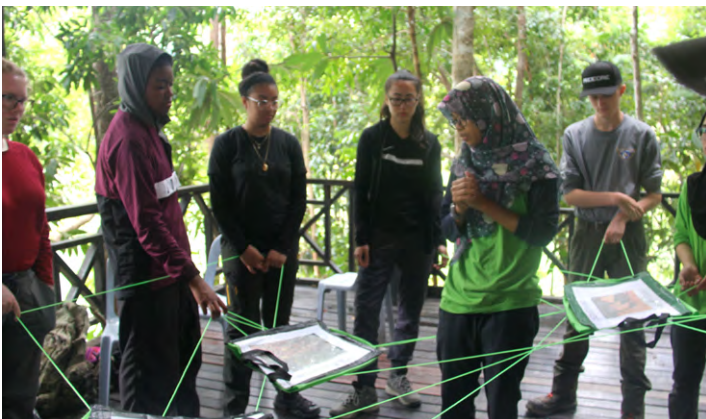
The ICE team participating in the web of life game.