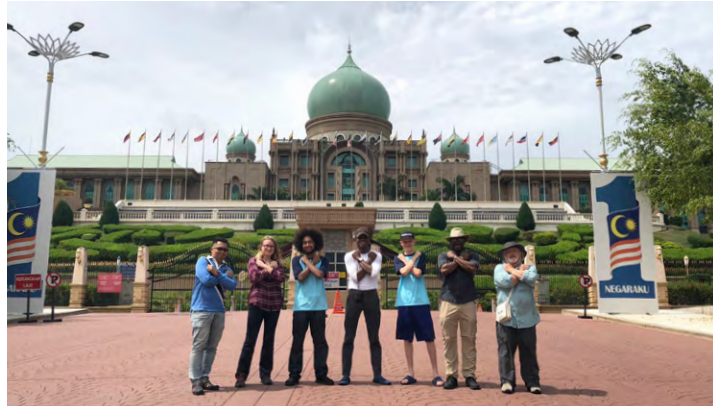
Having fun in Putrajaya.