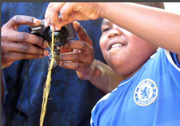
A Banun National Primary School student works with his I.C.E. student/teacher to tell a story about nature and Malaysia.