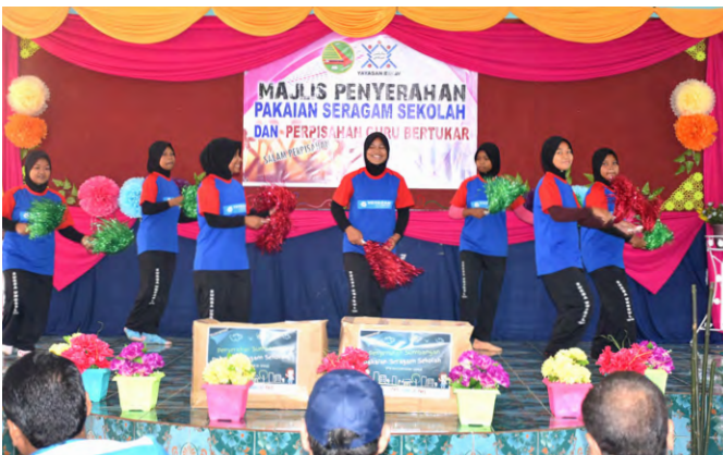
Sekitar Majlis Penyerahan Pakaian Seragam Sekolah 2018.