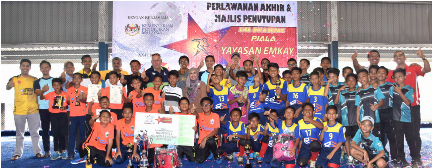
Tahniah buat para pemenang!!!