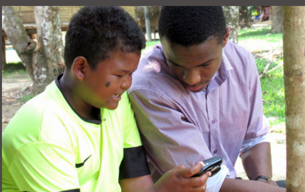
An I.C.E. Youth Media Program student/teacher works with a student to help tell their story through pictures.