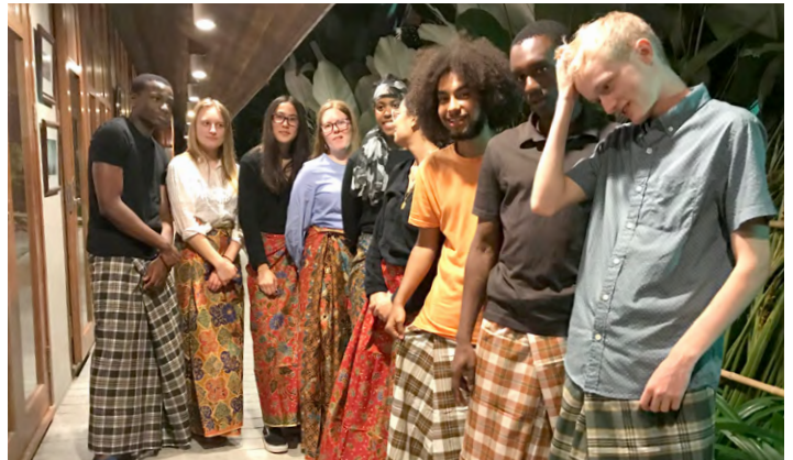
Parading in their 'Sarongs'.