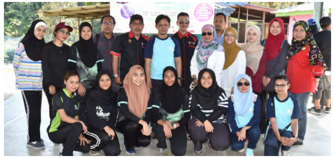
Kakitangan Yayasan EMKAY bersama sukarelawan.

YE mengucapkan ribuan terima kasih kepada semua sukarelawan yang telah membantu menyiapkan perpustakaan permainan baru ini, yang sesungguhnya amat dinanti-nantikan oleh anak-anak Kg Semelor.