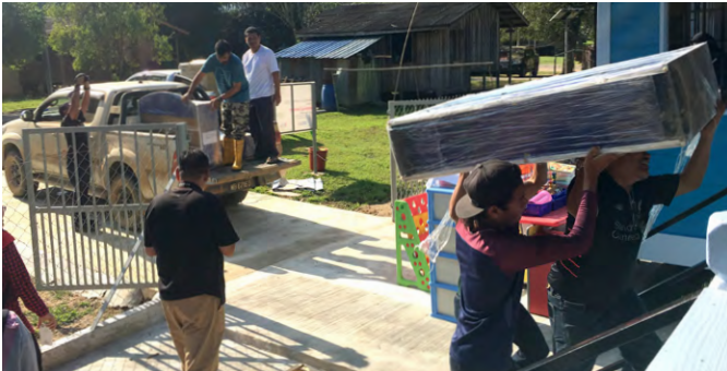
Sukarelawan mengangkat peralatan dari bangunan lama ke PPiP Kg Semelor yang baru.